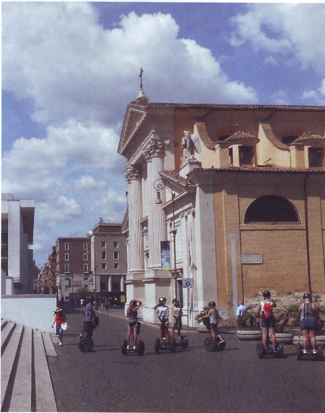
Ara Pacis och San Rocco kyrkan.

Vad är det som först slår en besökande till Svenska Institutet i Rom? Är det den breda trappan som leder upp till grinden? Eller den strama fasaden med tegel som skiftar i färg alltefter som solen ligger på? Och om man så bara kastar ett öga på några av byggnaderna i närheten, till exempel Rumänska institutet eller Brittiska skolan, märker man snabbt att här som så ofta i Rom har klassiskt och modernt fått samsas. Och det kan gälla både hela byggnadsstilen och de små detaljer som tillsammans skapar ett helhetsintryck för såväl Roms invånare som för studenter och turister.