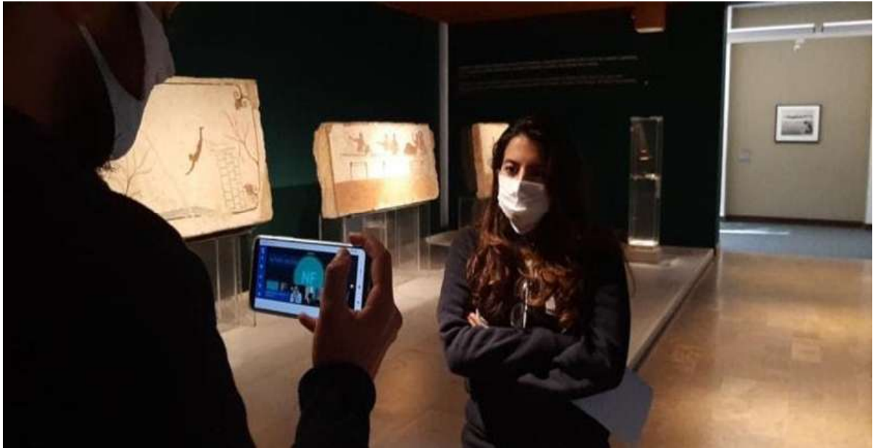
Fig. 1 - Museo archeologico di Paestum 2021: Visita in modalità ibrida (a distanza e con operatore dedicato) alla Tomba del Tuffatore durante la chiusura dei luoghi della cultura a causa della pandemia da Covid 19, nell'ambito del progetto "Un Tuffo nel Blu".