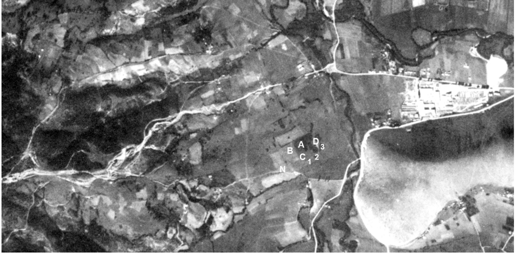
Fig. 2 Municipium S sull'immagine satellitare Corona del 29 settembre 1966 (DS1035-2136DF055). I numeri 1, 2 e 3 indicano i settori di scavo; le lettere A e B, C e D le aree investigate con metodi geofisici; la lettera N le necropoli.

due necropoli con sepolture a incinerazione in urne di ceramica e cassette di pietra, delle quali la prima (necropoli I), leggermente più antica (fine I sec. d.C.-inizi IV sec. d.C.), è caratterizzata da sepolture molto fitte e ravvicinate, senza un preciso ordine e prive di cippi sepolcrali. Un gruppo di tombe della necropoli I è certamente pertinente alla popolazione nativa, dato che alcune urne sono ancora realizzate a mano e sono racchiuse in un circolo di pietre o lastre, secondo un uso illirico molto diffuso.