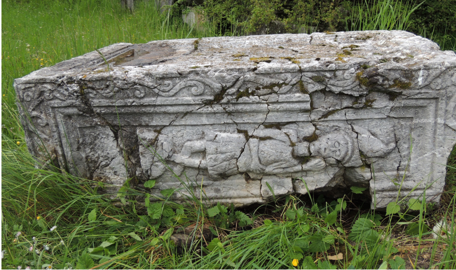
Fig. 3 Municipium S , necropoli II. Una lapide ancora in situ.

ratteri celtici sia nei nomi sia nelle ceramiche dipinte dei corredi 11 , mentre pochi nomi di origine tracica sono riferibili probabilmente ad alcuni immigrati nella regione, piuttosto che a una presenza anteriore alla fondazione della città.