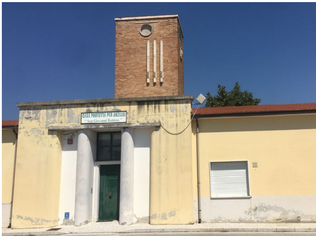
4: Villanova del Battista, Casa dell'assistenza oggi Casa per anziani.

L'ingresso principale - come spiega la planimetria - è posizionato sul lato corto orientale preceduto da un pronao, mentre l'angolo a nord-ovest è arrotondato per sfruttare al meglio le dimensioni del lotto. Come abbiamo già evidenziato nel paragrafo precedente l'edificio ha subito diversi rimaneggiamenti per essere adeguato alle nuove funzioni - da casa per gli anziani a centro sociale - ma sicuramente la forza del segno architettonico e il contesto lo hanno salvato dall'essere del tutto cancellato. Tale, infatti è il triste epilogo per la maggior parte di queste costruzioni, considerate dalla popolazione simbolo della povertà a cui il fascismo e la guerra avevano fatto precipitare questa terra e non certo espressione di uno stile architettonico da tutelare.