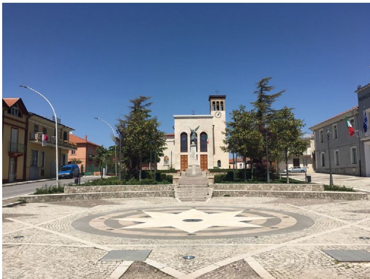
3: Aquilonia, Piazza Marconi.