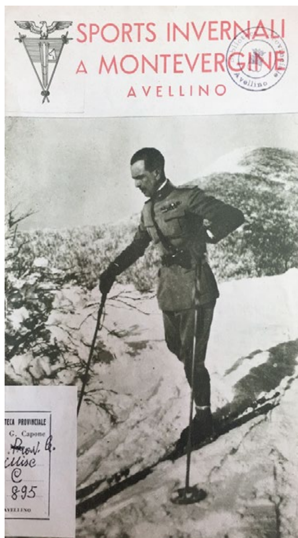
2: Sports invernali a Montevergine , Pergola, Avellino 1934.

Nell'opuscolo, pubblicato fra il 1934 e il 1935 (Fig. 2) per pubblicizzare questa prima stazione sciistica del Sud Italia, si dà grande rilevanza ai collegamenti, che sicuramente erano uno dei punti dolenti della provincia [Sport invernali a Montevergine sd]. Sul «Corriere dell'Irpinia» è pubblicato un disegno del tracciato di questa strada che ben rappresenta le difficili curve a gomito che dovevano essere realizzate per raggiungere il Colle Virgilio a quota 1415 metri [Corriere dell'Irpinia 1934]. Questa strada in realtà non era transitabile in inverno con mezzi automobilistici a causa delle pendenze troppo forti, mentre poteva essere percorso a piedi con comodità e facilità, come spiega il Presidente dell'Ente Turismo Irpino; per questo Ernesto Amatucci propose di realizzare una funivia che dal Santuario conducesse direttamente e in solo 8 minuti alla vetta più alta del Partenio: il dorsale Serralto, proposta che però rimase tale. Negli articoli viene spesso affrontata anche la questione della necessità di migliorare la qualità alberghiera, nello specifico di realizzare un grande albergo grazie agli incentivi messi in atto dal regime per l'edificazione ex novo o la ristrutturazione di fabbricati già esistenti ad uso alberghiero.