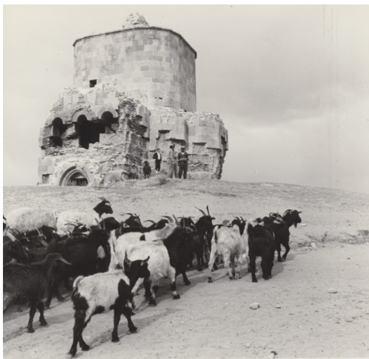
Figura 6 Kars, chiesa detta Beşik Camii, XI secolo. 1967.