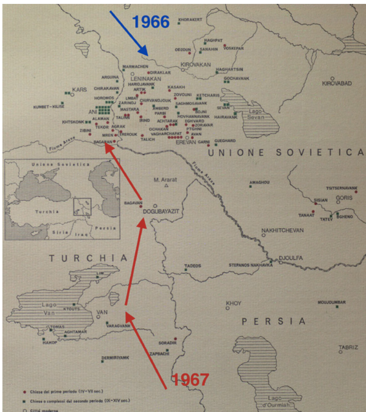
Figura 1 Turchia orientale e Caucaso meridionale, mappa con indicazione dei percorsi seguiti durante le missioni di studio della Sapienza 1966-67. Elaborazione da Architettura medievale armena , 1968

Tenuto conto di tali esplorazioni storiche, che avevano prodotto una notevole bibliografia, l'indagine sul campo in quei territori non era un'esperienza essenzialmente nuova e - va detto subito - non fu neppure unica in quanto tale, giacché missioni scientifiche nel Vicino Oriente venivano condotte in quel tempo anche da altri studiosi, sia stranieri che italiani. Tra questi ultimi, si ricorda che negli stessi anni anche un gruppo di ricerca del Politecnico di Milano, coordinato da Adriano Alpagò Novello, si rivolgeva al Caucaso e si apprestava a compiere viaggi di studio che contribuirono grandemente alla conoscenza dell'architettura armena attraverso pubblicazioni ed eventi espositivi.