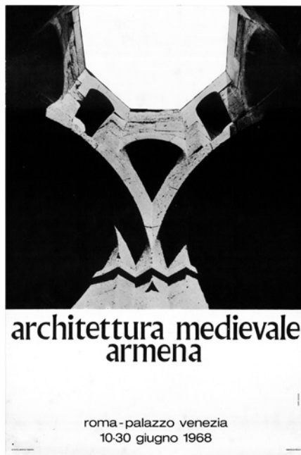
Figura 10 Locandina della mostra Architettura medievale armena , Roma 1968

Il bagaglio di fotografie storiche eseguite dai passati esploratori, la conoscenza puntuale dei disegni e delle incisioni pubblicate dai viaggiatori che avevano preceduto i nostri studiosi forniva loro già una prima 'lente' attraverso cui avvicinarsi all'osservazione di ciascun monumento. Ciò è evidente nel tentativo di ritrarre, ogni qualvolta fosse possibile, gli stessi edifici dallo stesso punto di vista degli antichi osservatori dando così l'esatta misura di ogni cambiamento, piccolo o grande, intervenuto nel tempo. Macroscopico il caso del convento di Tatev, ritratto in un'incisione pubblicata nell'opera di Ghevond Alichan del 1893 nel suo complesso ancora intatto e funzionante, ma che le fotografie della missione degli anni Sessanta mostrano pesantemente danneggiato a causa del terremoto del 1931 [figg. 8-9]. Si dava così modo di riflettere con nuova coscienza sul valore della ricerca scientifica come elemento della storia di un monumento. In altre parole, la consapevolezza che l'esser stato fatto oggetto di indagine in un determinato modo e in un dato momento storico, ciò stesso fa parte della vita dell'opera d'arte, giacché ogni nuovo studio, costruito sulle fondamenta di quelli precedenti, non solo ne approfondisce la conoscenza, ma finisce per cambiarne sensibilmente la percezione.