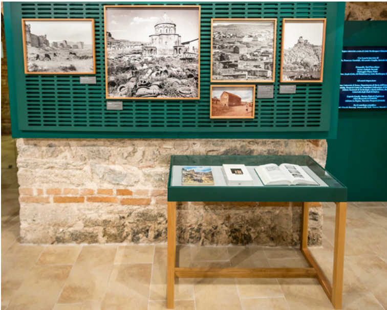
Figure 14-15 Istanbul, Koç University, ANAMED. Mostra fotografica Picturing a Lost Empire: An Italian Lens on Byzantine Art in Anatolia, 1960-2000.