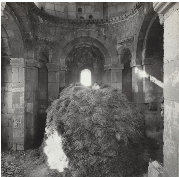
Figura 5 Soradir, chiesa di Sant'Etchmiadzin, VI-VII secolo. Interno, 1967.

L'uso estensivo della fotografia fu strumento essenziale per la raccolta di documentazione che fu sin dall'inizio uno degli scopi primari delle spedizioni scientifiche. Gli scatti venivano realizzati da tutti i punti di osservazione possibili, a volte sfruttando persino occasioni estemporanee, come nel singolare caso della chiesa di Soradir, all'epoca usata dai contadini locali come pagliaio, circostanza che si rivelò a Paolo Cuneo inaspettatamente utile per fotografarne da vicino dettagli dell'ornamentazione interna alla base della cupola nonché per apprezzarne la planimetria da un punto di osservazione elevato [fig. 5]. 19 Le foto restituiscono così anche immagini dei monumenti, per così dire, 'abitate' dalla vita quotidiana di cui erano divenute parte, catturando nell'obiettivo la testimonianza preziosa di un anno, un giorno, un secondo irripetibili [figg. 6-7].