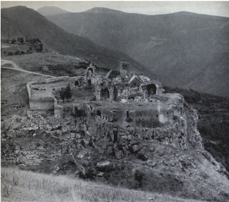
Figura 8 Convento di Tatev, IX-XI secolo, in un'incisione da G. Alishan, Sisakan, Venezia 1893. Da Architettura medievale armena