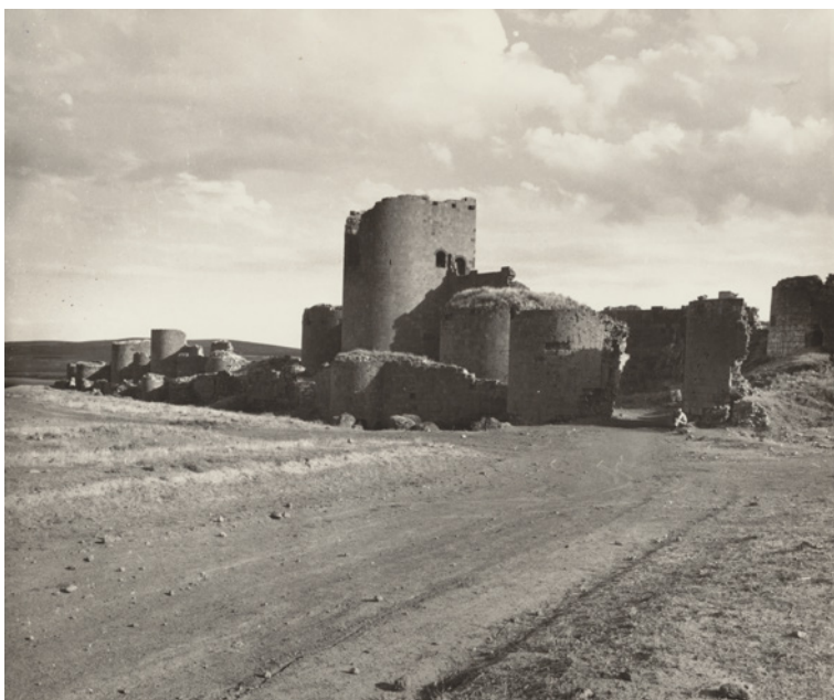
Figura 2 Ani, mura. Ca. 1967.

ai manufatti architettonici databili tra il IV e il XIV secolo. Essi consistevano per lo più in complessi religiosi (di numero complessivo certamente più consistente), ma accanto a questi figurano anche capolavori dell'architettura civile - ricordiamo ad esempio lo straordinario materiale fotografico relativo alle mura di Ani [fig. 2] o alla cittadella di Kars.