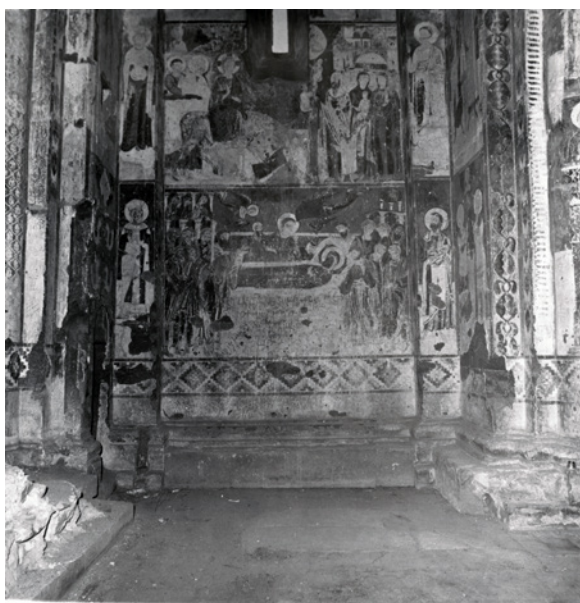
Figura 3 Ani, chiesa di San Gregorio di Tigran Honents, XIII secolo. Dettaglio della decorazione scultorea. Ca. 1967.