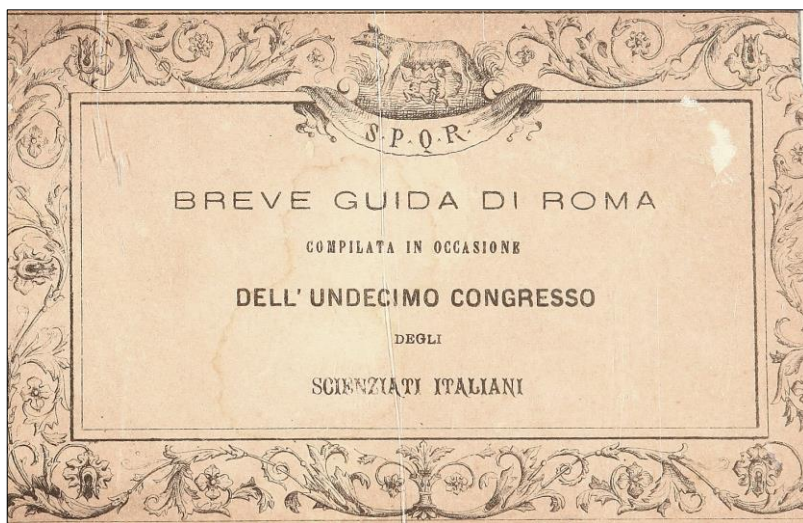
Figura 2. Un esempio di guida sintetica compilata per accompagnare gli scienziati. Breve guida di Roma (frontespizio), 1873

Più o meno le stesse indicazioni emergono dalla Guida pratica popolare di Roma ad uso specialmente degli impiegati, negozianti, Capi di Famiglia, e di tutti coloro che stanno per trasferirvisi , di Bignami (1871). In questo caso, come sottolinea il suo stesso autore, il testo è a uso dei «trasferibili» e non per i turisti. In altre parole, possiede tutte quelle caratteristiche per essere «una guida preventiva, uno strumento preparatorio alla conoscenza diretta della città, da leggere ancora prima di raggiungerla» (De Caprio, 2007, p. 18). Queste le ragioni per cui nella prefazione si indulgia sulla descrizione «del cittadino romano a dispetto del torinese e del fiorentino, cioè dei cittadini delle due capitali provvisorie» (Bignami, 1871, p. 4), tipologie caratteriali tra il folcloristico e lo stereotipato.