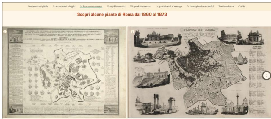
Figura 4. Lo strumento sidecar per scoprire alcune delle piante di Roma (1860-1873). Elaborazione delle autrici (digital storymap)

La predisposizione della storymap "Roma in un colpo d'occhio" 12 (utilizzando lo strumento sviluppato da ESRI 13 ), è stata ottenuta combinando le tecniche di digital storytelling con la mappatura dei luoghi più iconemici della città (digital storymapping), restituiti mediante un allestimento facilmente fruibile e a forte impatto iconografico (tour mappa e sidecar).