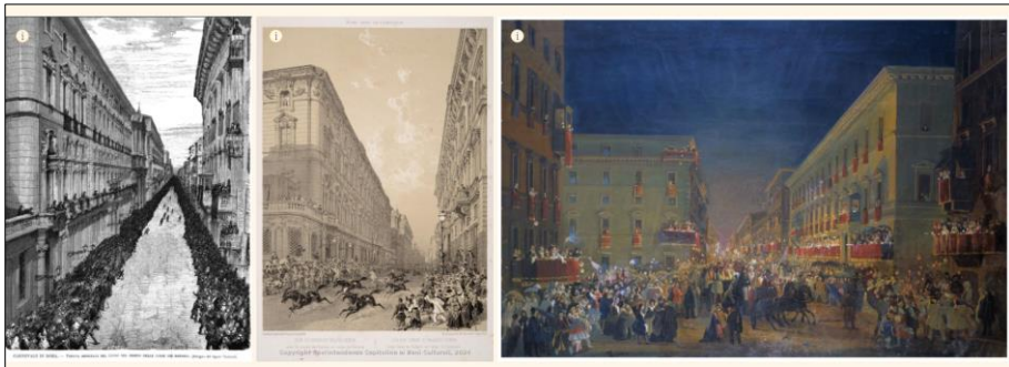
Figura 6. L'apparato iconografico che accompagna l'approfondimento su via del Corso. Elaborazione delle autrici (digital storymap)

Altre passeggiate si irradiano per la città, percorrendo via del Corso, via Sistina e via Gregoriana. Se quest'ultima è definita da Bersezio (1872, p. 375) uno dei luoghi “più belli” della Roma moderna, via del Corso, più simile a un lungo e stretto corridoio che non a un viale cittadino di ampio respiro, ha per secoli rappresentato la strada privilegiata. Prescelta, infatti, da papa Paolo II quando, nel 1446, vi trasferì i giochi e le corse dei cavalli durante le celebrazioni del caratteristico carnevale romano. Le guide quasi all'unisono la celebrano e la descrivono come «la strada principale di Roma [che] trae il suo nome dalle corse dei cavalli [berberi] che vi si fanno» (Finardi, 1864, p. 16). Il punto di inizio era fissato in piazza del Popolo e l'arrivo era in piazza Venezia. La manifestazione, così unica e particolarmente vissuta dagli abitanti della città e dai viaggiatori, fu abbandonata nella Roma post-unitaria e, con la sua abolizione, venne meno anche il carnevale e il fascino che fino a quel momento aveva suscitato nei visitatori stranieri, ispirando i tanti testi della letteratura di viaggio, e negli estensori delle guide stesse.