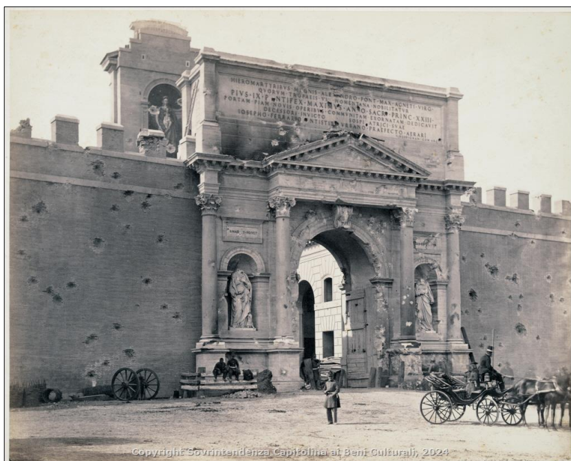
Figura 3. Porta Pia con i segni del bombardamento. Gioacchino Altobelli o Ludovico Tuminello, 1870, stampa all'albumina, per gentile concessione del Museo di Roma. Le autrici ringraziano per il tempo dedicato Claudio Parisi Presicce (sovrintendenza capitolino), Ilaria Miarelli Mariani (direttrice Musei civici - Sovrintendenza capitolina)

A partire dal racconto di quanto accaduto a Roma con l'entrata delle truppe italiane, De Amicis nelle sue Impressioni di Roma , passa a celebrare le “meraviglie” della città, da lui stesso descritte come «i più stupendi monumenti» (Ivi, p. 65). Stessi echeggiamenti politico-celebrativi in Roma la Capitale d'Italia (1872) di Vittorio Bersezio, opera suddivisa in quattro parti dedicate alla Roma antica, alla Roma dei papi, alla Roma moderna e “libera”.