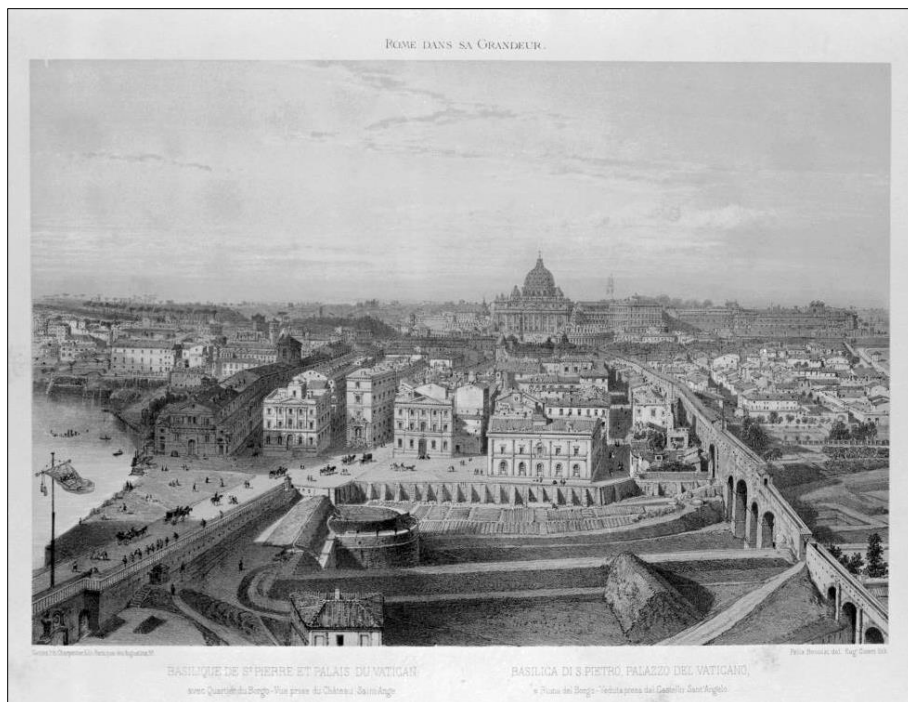
Figura 1. Veduta da Castel Sant'Angelo di San Pietro. Philippe Benoist, 1870