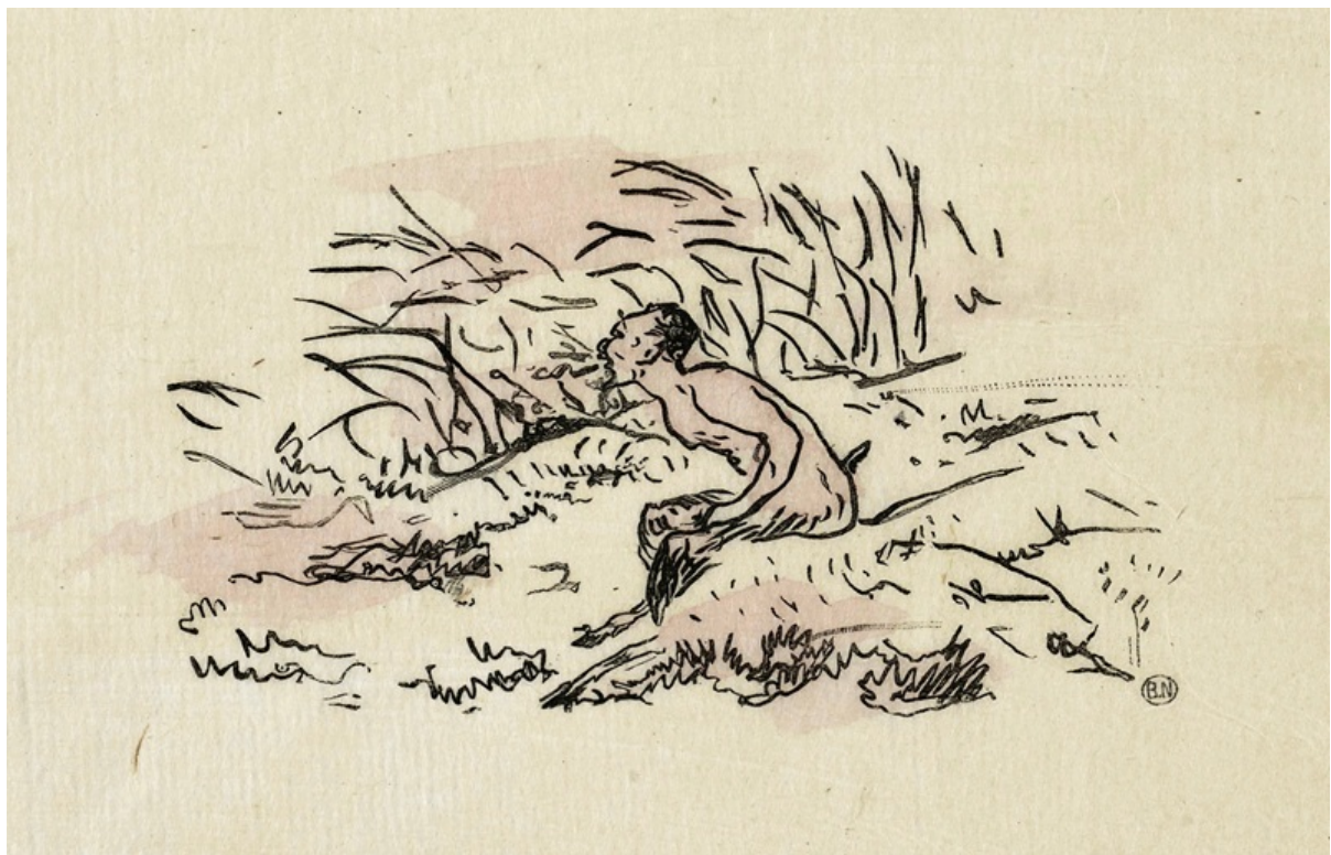
Ill. 3: frontespizio de L'après-midi d'un faune di Stéphane Mallarmé, xilografia di Édouard Manet (1876)