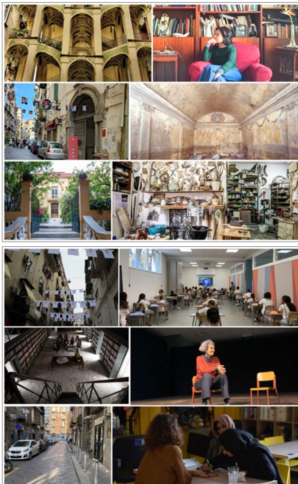
In alto: Figura 2. Le pratiche narrate nel Rione Vergini-Sanità (nell'ordine: Brodo ; Ipogeo dei Cristallini ; Laboratorio Oste ); qui accanto: Figura 3. Le pratiche narrate nel Rione Forcella (nell'ordine: La Casa di Vetro ; f.pl. femminile plurale ; La Radice di Coira ).

dell'associazione Celanapoli che opera nel rione Sanità per il recupero e la fruizione degli spazi ipogei. L'analisi di questa pratica, pur di limitata dimensione e raggio d'azione, contribuisce all'identificazione della rete che si sta sviluppando tra iniziative di diversa natura collegate alla creatività e alla fruizione del patrimonio culturale.