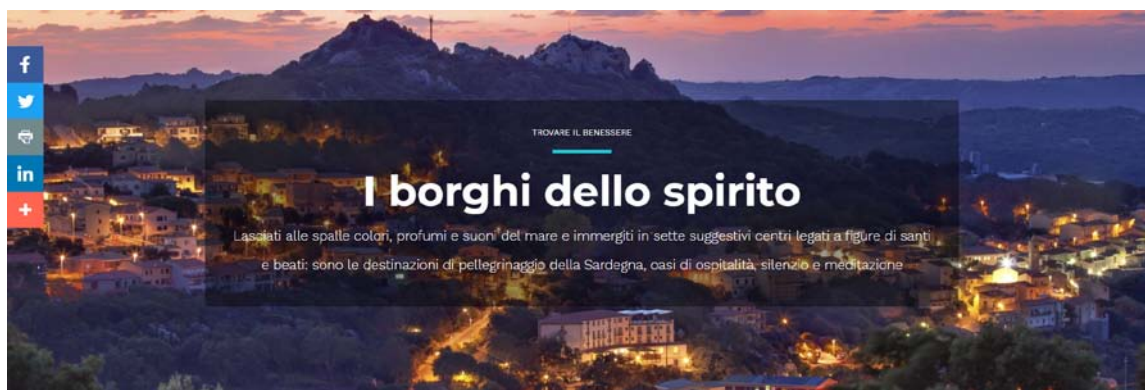
Fig. 4 Pagina web che pubblicizza il turismo dei cammini religiosi, richamandone anche le valenze esperienziali. Fonte: < https://www.sardegnaturismo.it/it/i-borghi-dello-spirito >.

da significati religiosi e storico-culturali, sia da elementi legati alla sfera dell'emozionalità. Inoltre costituiscono un nuovo modello di vacanza che offre un ritorno alla natura, la riscoperta della spiritualità, la demassificazione dei consumi, la ricerca di benessere psicofisico, vacanze di tipo esperienziale (Morazzoni - Boiocchi, 2013): contesti ed emozioni che in Sardegna si possono godere con estrema facilità (Fig. 4).