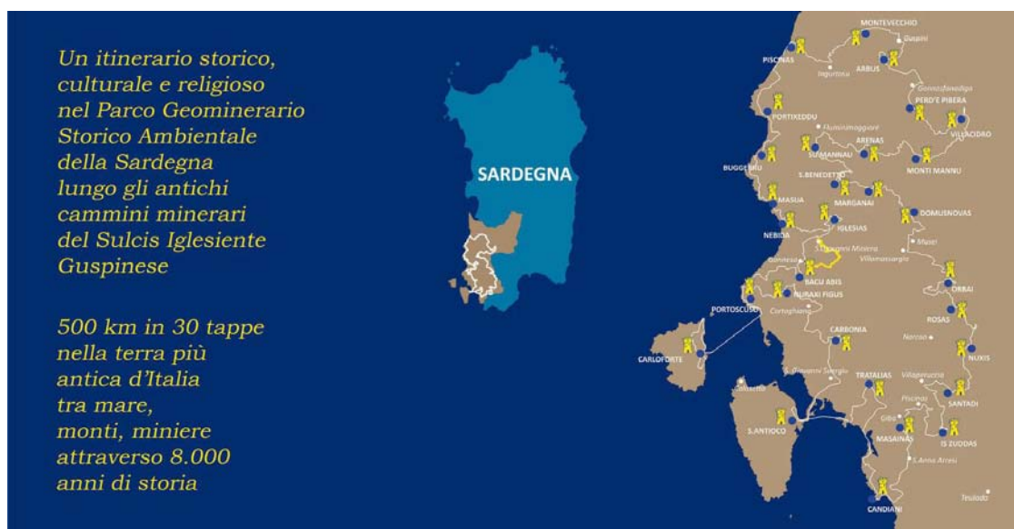
Fig. 3 Il percorso e le tappe del Cammino minerario di Santa Barbara.

Tra i cammini sardi è di particolare rilievo il Cammino di Santa Barbara patrona dei minatori (Fig. 3), unico entrato a far parte del Registro dei Cammini d'Italia e del correlato Atlante digitale dei Cammini d'Italia 21 .