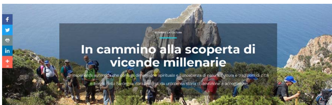
Fig. 1. Pagina web che pubblicizza il turismo dei cammini religiosi, nello sfondo un tratto del Cammino di Santa Barbara.

La Sardegna, che per il suo clima mite si presta ad ospitare turisti durante tutto l'anno, può sfruttare questo vantaggio con la proposta di cammini e itinerari permanenti che possano essere percorsi in qualsiasi momento dell'anno, diventando così un nuovo volano di sviluppo e un fattore di crescita dell'economia nei suoi vari comparti. Sebbene l'isola non sia una meta tradizionale di pellegrinaggi, infatti, la Regione Autonoma da qualche anno si è attivata per creare e promuovere una filiera del turismo religioso isolano (Fig. 1), inteso come un prodotto utile per destagionalizzare e diversificare i flussi turistici e che, allo stesso tempo, consente di valorizzare un heritage non consueto o spesso "inavvertito", come quello dei santuari e luoghi di culto minori (Rizzo - Rizzo - Trono, 2013).